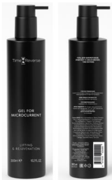
490025 – 300 мл